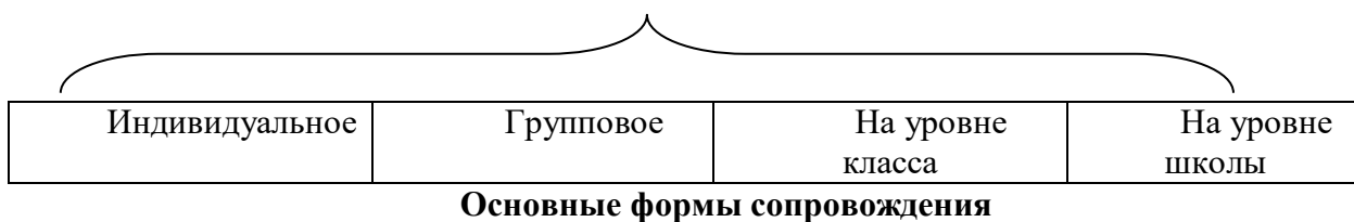
Рис. 1. Уровни психолого-педагогического сопровождения

Модель психолого-педагогического сопровождения участников образовательного процесса на основной ступени общего образования (рис. 1.)