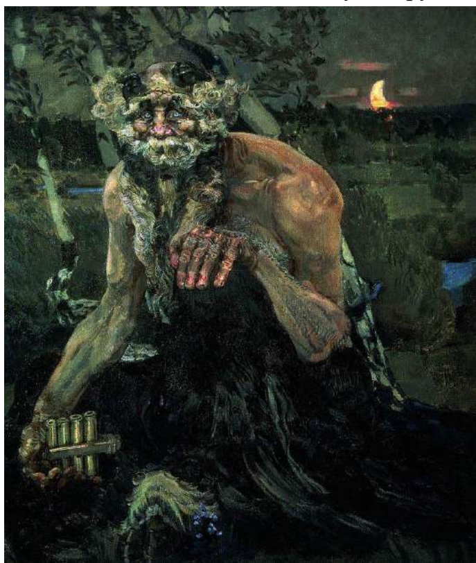
7. М. А. Врубель. Пан.

6. Изделия декоративно-прикладного искусства (например, глиняные игрушки, хохломская или гжельская посуда, кружева).