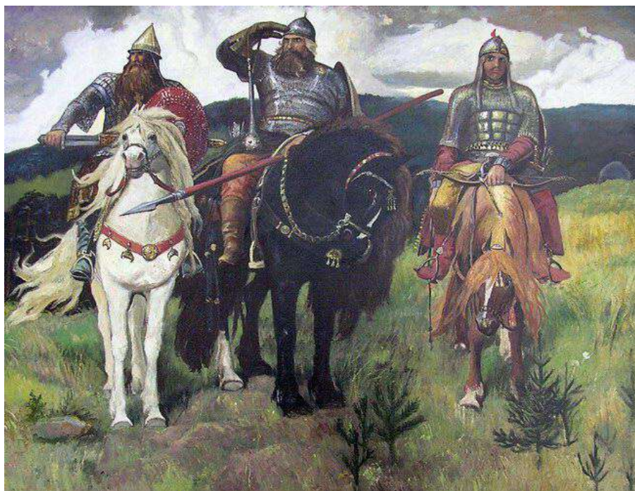
8. В. М. Васнецов. Богатыри.