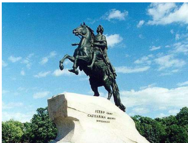
10. Э.М. Фальконе. Памятник Петру I в Санкт-Петербурге

15. Выполнить графический рисунок натюрморта с передачей светотени (блик, свет, полутьма, тень, рефлекс, падающая тень).